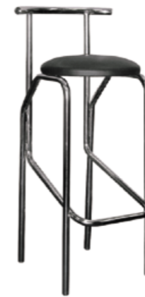
Marco hoker chrom