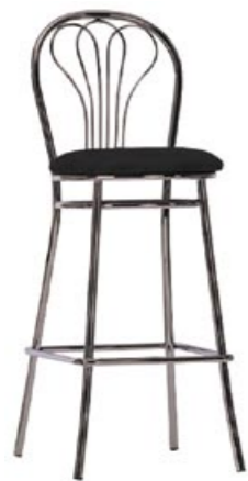
Venus hoker chrom