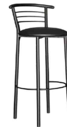
Marco hoker black