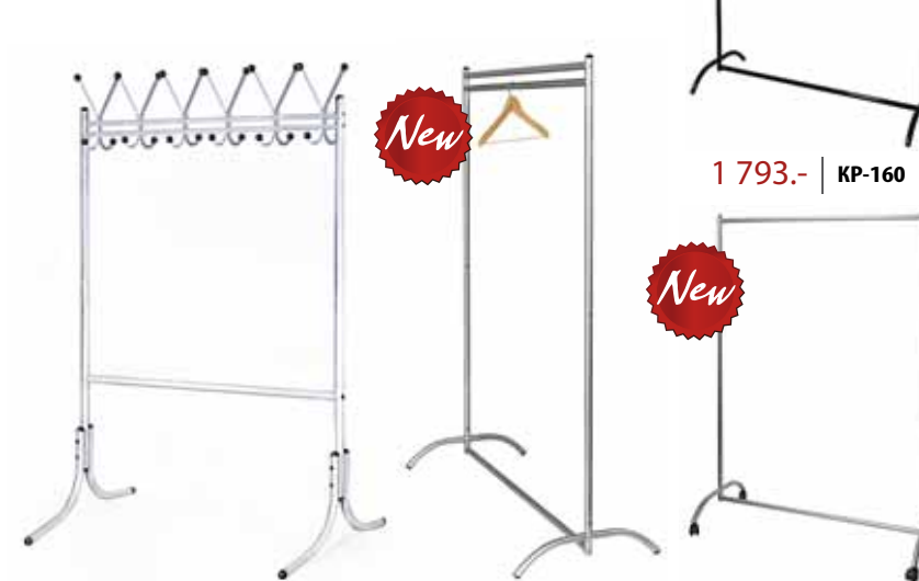
4 083.- | KP-11 2 664.- | KP-160UC 2 412.- | KP-160M