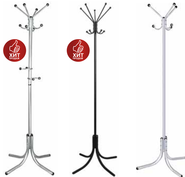
2 166.- | K-10 1 887.- | KP-10P 1 577.- | KP-14