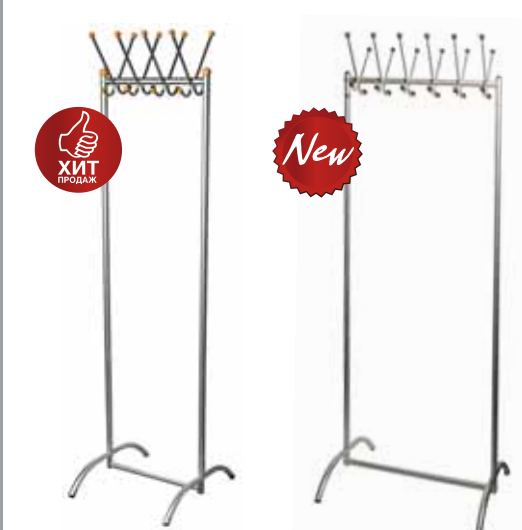
1 793.- | KP-15 3 140.- | KP-110