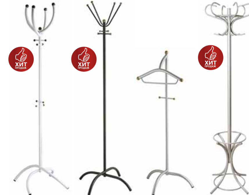
1 395.- | KP-190 1 246.- | KP-185 1 397.- | KP-130 2 895.- | ВЕНЕЦИЯ