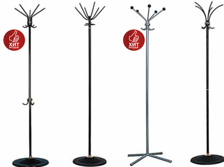
2 121.- | CC 1 410.- | TH 1 797.- | TX 1 903.- | TMM