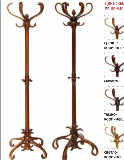
5 382.- | КРП1/1 6 635.- | КРП1/2