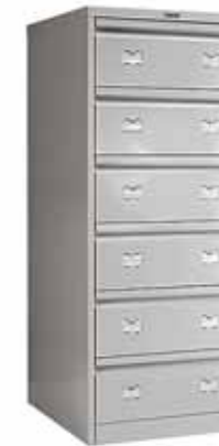
11 538.- AFC-06 для подвесных папок формата A5 и A6 552x631x1327 (62 кг)