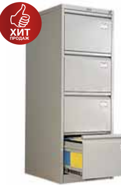
9 478.- AFC-04 для подвесных папок формата A4 470x630x1330 (50 кг)