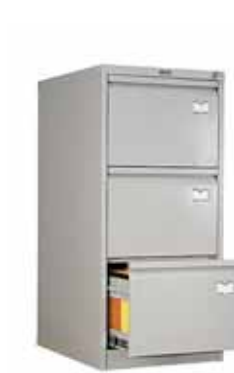
8 086.- AFC-03 для подвесных папок формата A4 467x630x1020 (39 кг)