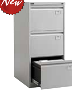
12 012.- NF-03 467x630x1020 (45 кг)