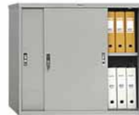
8 871.- AMT-0891 1 полка 915x458x832 (27 кг)