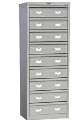
19 040.- AFC-09C для подвесных папок формата A6 470x631x1327 (75 кг)