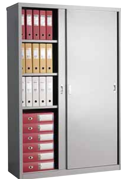
16 064.- AMT-1812 4 полки 1215x458x1830 (67 кг)