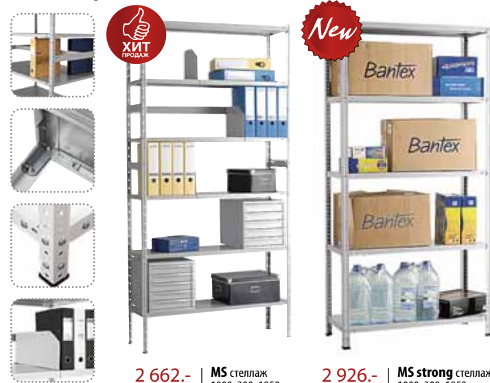
2 662.- | MS стеллаж 1000x300x1850

Благодаря широкому выбору комплектующих (5 типоразмеров стоек и 8 типоразмеров полок) эта серия предоставляет неограниченные возможности комплектации стеллажей для помещений любой площади. Максимальная распределенная нагрузка на полку до 100 кг, максимальная нагрузка на стеллаж с использованием стойки MS - 600 кг, с использованием стойки Strong MS – 750 кг.