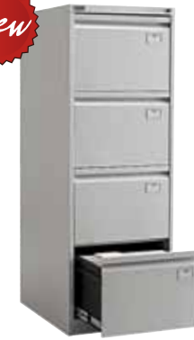
14 219.- NF-04 467x630x1330 (56 кг)