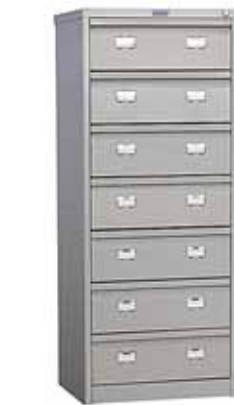
13 682.- AFC-07 для подвесных папок формата A5 515x631x1327 (71 кг)