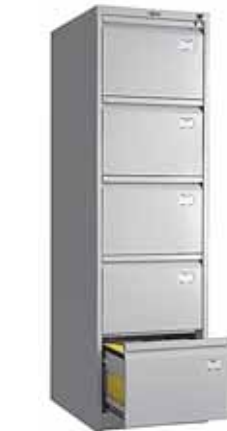
11 788.- AFC-05 для подвесных папок формата A4 467x630x1634 (61 кг)