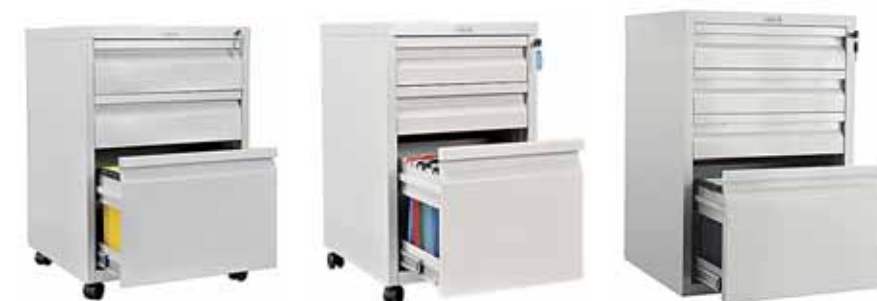
6 418.- | AP-1 | 470x490x700 (27 кг) 5 133.- | AP-2 | 420x490x655 (23 кг) 6 787.- | BFC-70/4 | 480x490x705 (25 кг)

Мобильные тумбы предназначены для хранения документации и канцелярских принадлежностей. Выдвижные ящики установлены на телескопические направляющие. Комплекуются колесами, два передних снабжены стопорами.