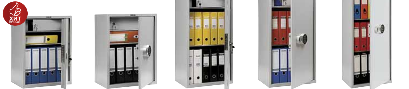
3 334.- | SL-65T | 460x340x630 (20 кг) 5 716.- | SL-65T EL | 460x340x630 (20 кг) 4 395.- | SL-87T | 460x340x870 (25 кг) 6 775.- | SL-87T EL | 460x340x870 (25 кг) 7 729.- | SL-125T EL | 460x340x1252 (33 кг)