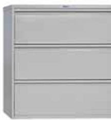
15 467.- AMF-1091/3 для подвесных папок формата A4 915x460x998 (50 кг)