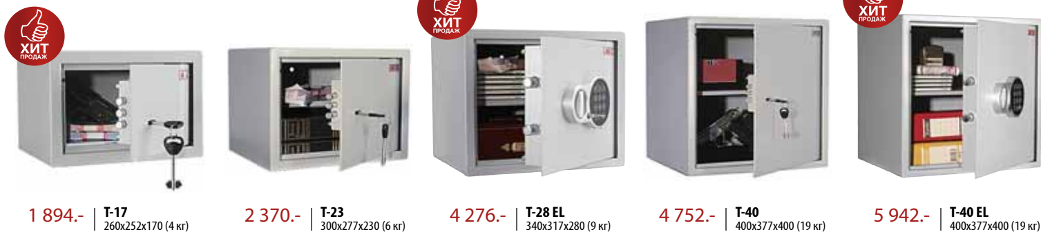
1 894.- | T-17 | 260x252x170 (4 кг) 2 370.- | T-23 | 300x277x230 (6 кг) 4 276.- | T-28 EL | 340x317x280 (9 кг) 4 752.- | T-40 | 400x377x400 (19 кг) 5 942.- | T-40 EL | 400x377x400 (19 кг)