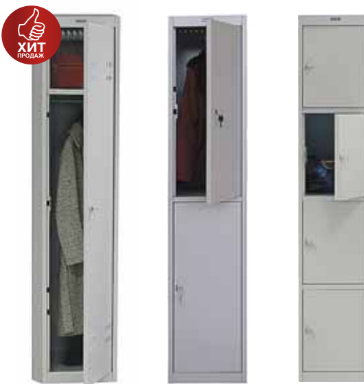
6 896.- | AL-01 гардероб 360x590x1830 (30 кг)

Гардеробные шкафы серии ПРАКТИК AL предназначены для хранения сменной одежды в производственных, спортивных и других помещениях, а также для организации камер хранения. Шкафы серии AL могут запираются на навесной или встроенный замок. При сборке шкафов этой серии рекомендуется использовать сочетание основной и приставных секций для значительного снижения стоимости.