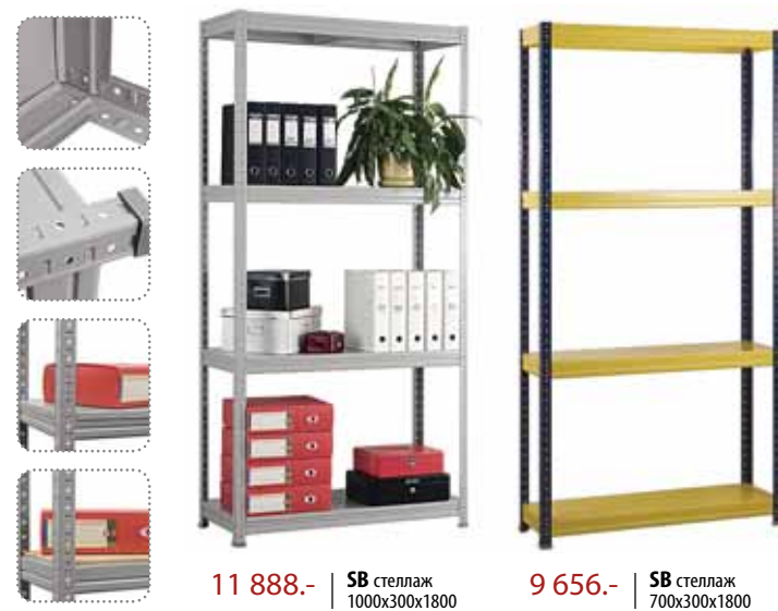
11 888.- | SB стеллаж 1000x300x1800

Универсальная система хранения. Быстрая и легкая сборка стеллажей осуществляется без болтов. Стойки сборные (компактная упаковка) Шаг перфорации в стойках - 38 мм, позволит разместить полки самым удобным образом.