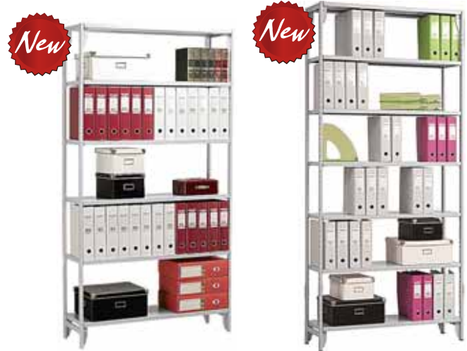
8 519.- | N-1900-6 (6 полок) 1000x300x1900 (15 кг)

Стеллажи серии NOBILIS предназначены для хранения документации в офисе или архиве. Крепление позволяет конструкции быть прочной, сборка стеллажей осуществляется без болтов. Шаг перфорации в стойках 32 мм позволяет легко найти самое удачное месторасположение полок. Существует возможность сборки в линию или секции, что снижает стоимость за счет уменьшения количества стоек. Максимальная нагрузка на полку – до 100 кг.