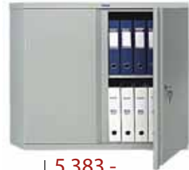
5 383.- AM-0891 1 полка 915x458x832 (27 кг)