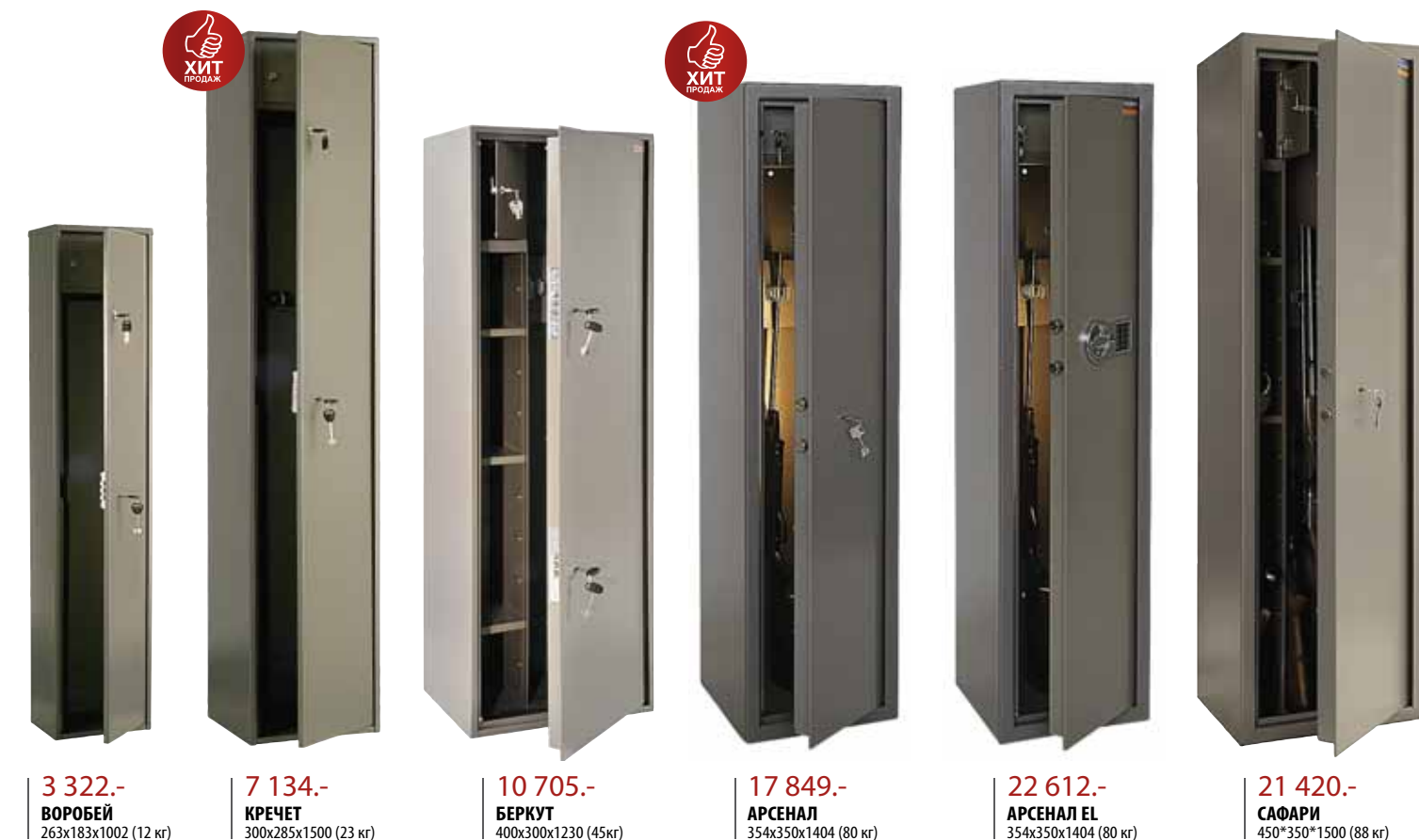
3 322.- | ВОРОБЕЙ | 263x183x1002 (12 кг) 7 134.- | КРЕЧЕТ | 300x285x1500 (23 кг) 10 705.- | БЕРКУТ | 400x300x1230 (45 кг) 17 849.- | АРСЕНАЛ | 354x350x1404 (80 кг) 22 612.- | АРСЕНАЛ EL | 354x350x1404 (80 кг) 21 420.- | САФАРИ | 450*350*1500 (88 кг)