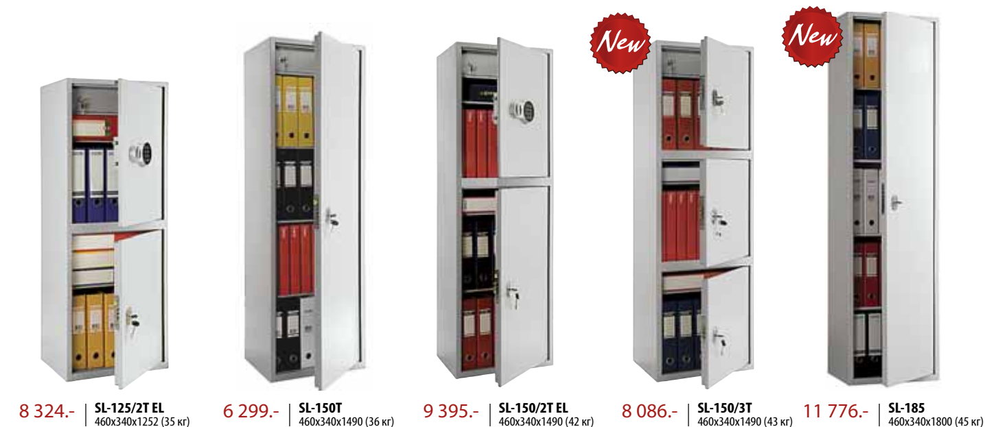
8 324.- | SL-125/2T EL | 460x340x1252 (35 кг) 6 299.- | SL-150T | 460x340x1490 (36 кг) 9 395.- | SL-150/2T EL | 460x340x1490 (42 кг) 8 086.- | SL-150/3T | 460x340x1490 (43 кг) 11 776.- | SL-185 | 460x340x1800 (45 кг)