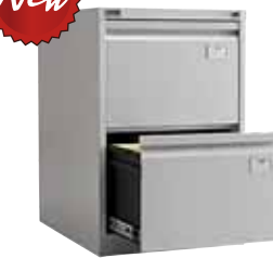
8 458.- NF-02 467x630x713 (32 кг)