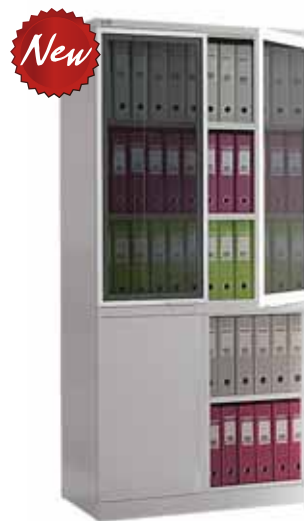
15 875.- NM-1991/2G 915x458x1990 (60 кг)