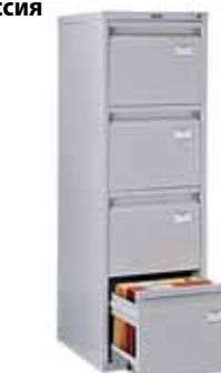
8 324.- A-44 для подвесных папок формата A4 408x480x1305 (38 кг)