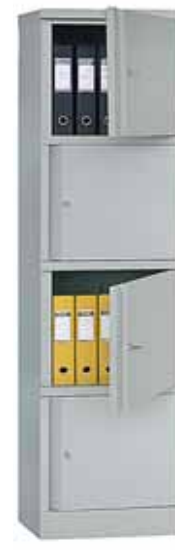
7 705.- AM-1845/4 4 отделения 472x458x1830 (38 кг)