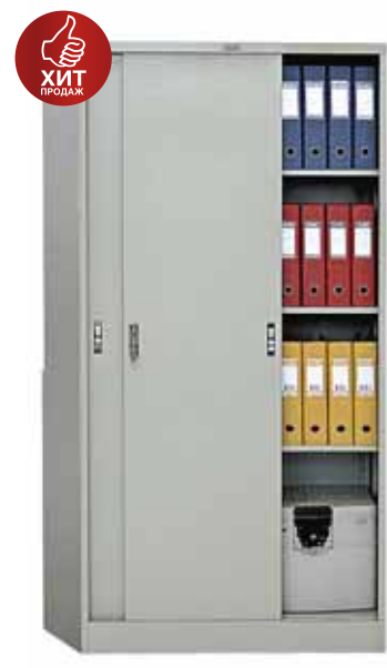
12 849.- AMT-1891 3 полки 915x458x1830 (54 кг)