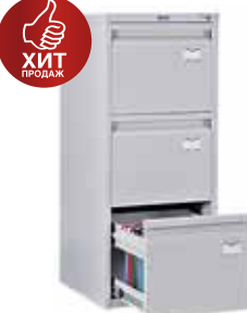
7 061.- A-43 для подвесных папок формата A4 408x480x995 (29 кг)