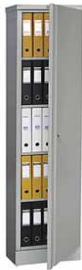
5 775.- AM-1845 4 полки 472x458x1830 (36 кг)