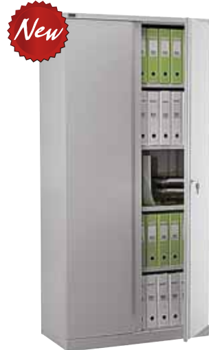
12 196.- NM-1991 915x458x1990 (57 кг)