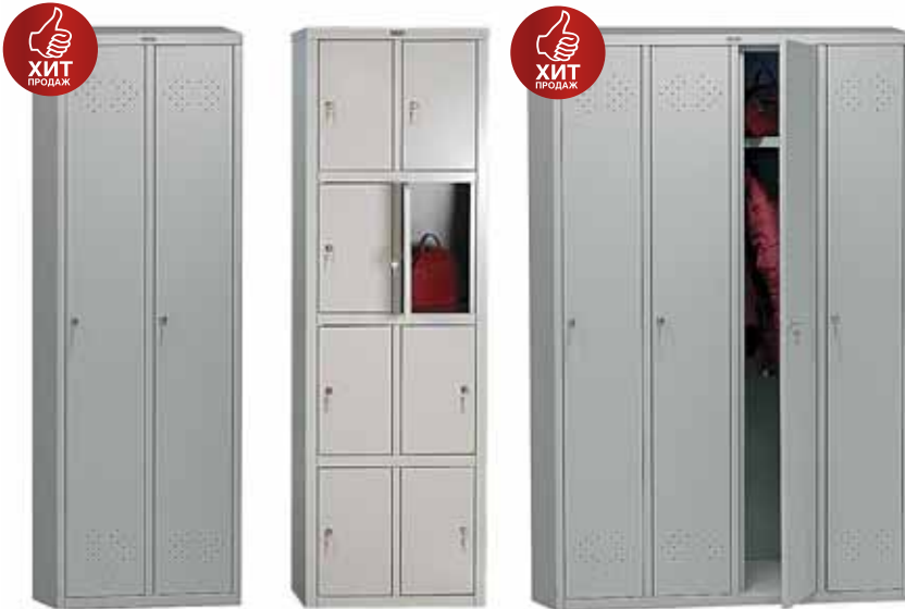
4 369.- | LE-21 гардероб (2 секции) 575x500x1830 (33 кг)

Гардеробные шкафы серии ПРАКТИК LE предназначены для хранения сменной одежды в производственных, спортивных и других помещениях, а также для организации камер хранения. Шкафы серии LE оснащены встроенными замками, каждая секция комплектуется полкой, перекладиной и крючками. Возможна дополнительная установка полок для обуви. Характеризуется высоким качеством изготовления и приемлемой ценой.