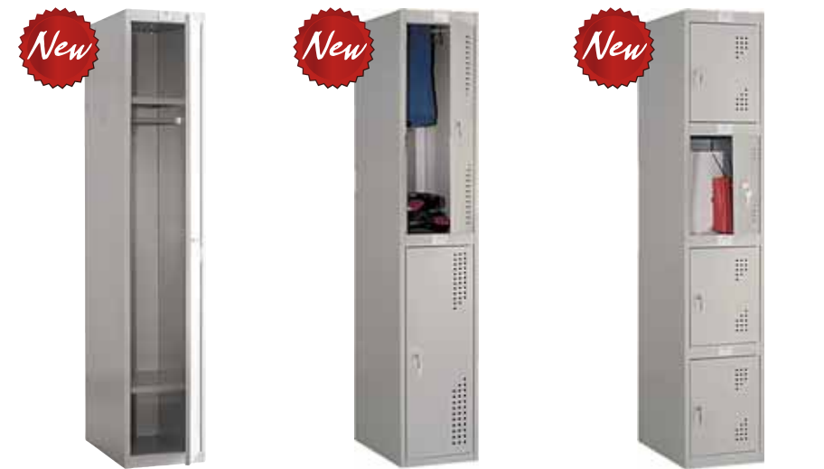
9 009.- | NL-01 2 полки, 1 перекладина, 2 крючка 360x590x1900 (35 кг)

Гардеробные шкафы серии NOBILIS предназначены для хранения сменной одежды и личных вещей. Шкафы оснащены полками, перекладиной для плечиков, крючками для одежды и рамками для информации, а также вентиляционными отверстиями. В шкафах установлен ключевой замок EURO-LOCK (Германия) повышенной секретности на 10 000 комбинаций. Конструкция шкафов позволяет скреплять их между собой.