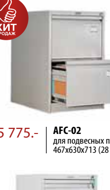
5 775.- AFC-02 для подвесных папок формата A4 467x630x713 (28 кг)