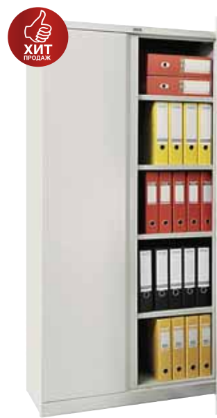
7 061.- M-18 4 полки 915x370x1830 (45 кг)