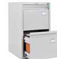
5 109.- A-42 для подвесных папок формата A4 408x480x685 (21 кг)