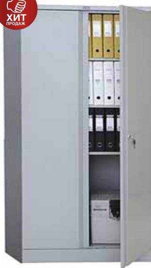
7 705.- AM-1891 3 полки 915x458x1830 (52 кг)