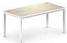
Прямоугольные столы на металлическом каркасе