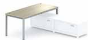
Приставные прямоугольные столы с опорой на несущую тумбу