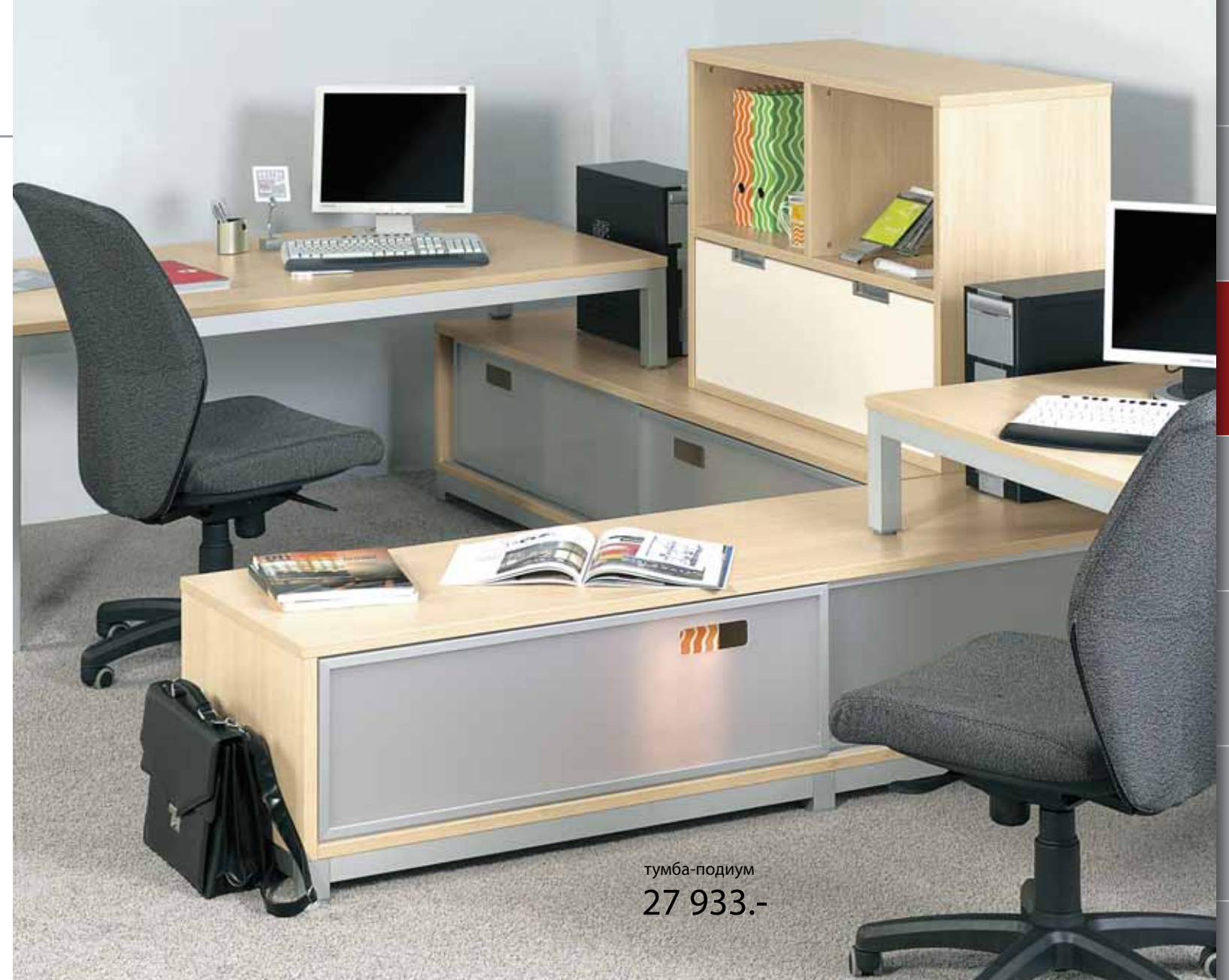
тумба-подиум 27 933.-