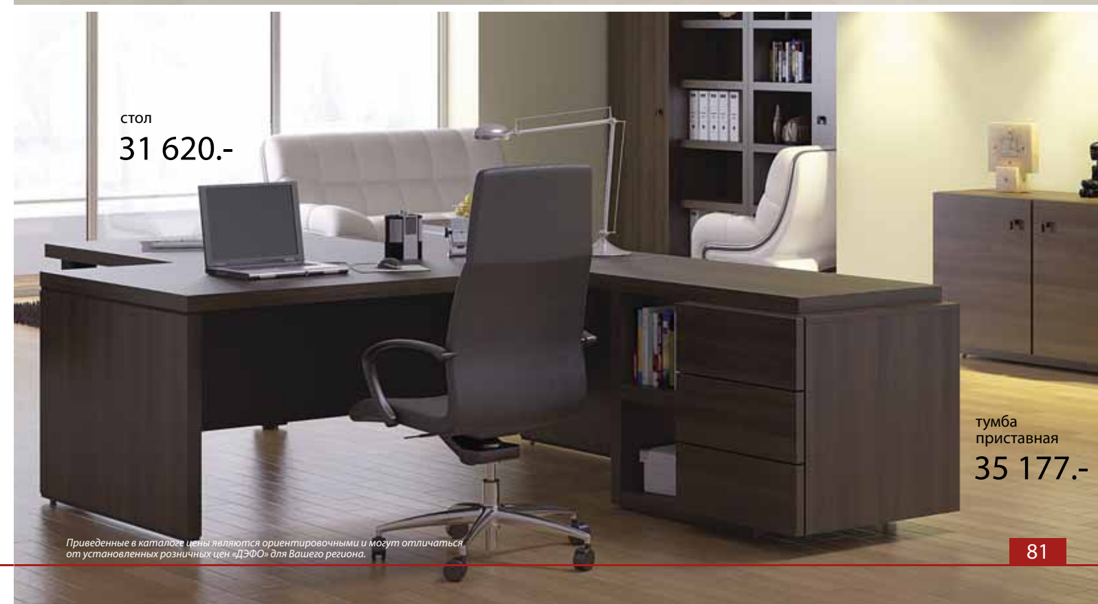
стол 31 620.-