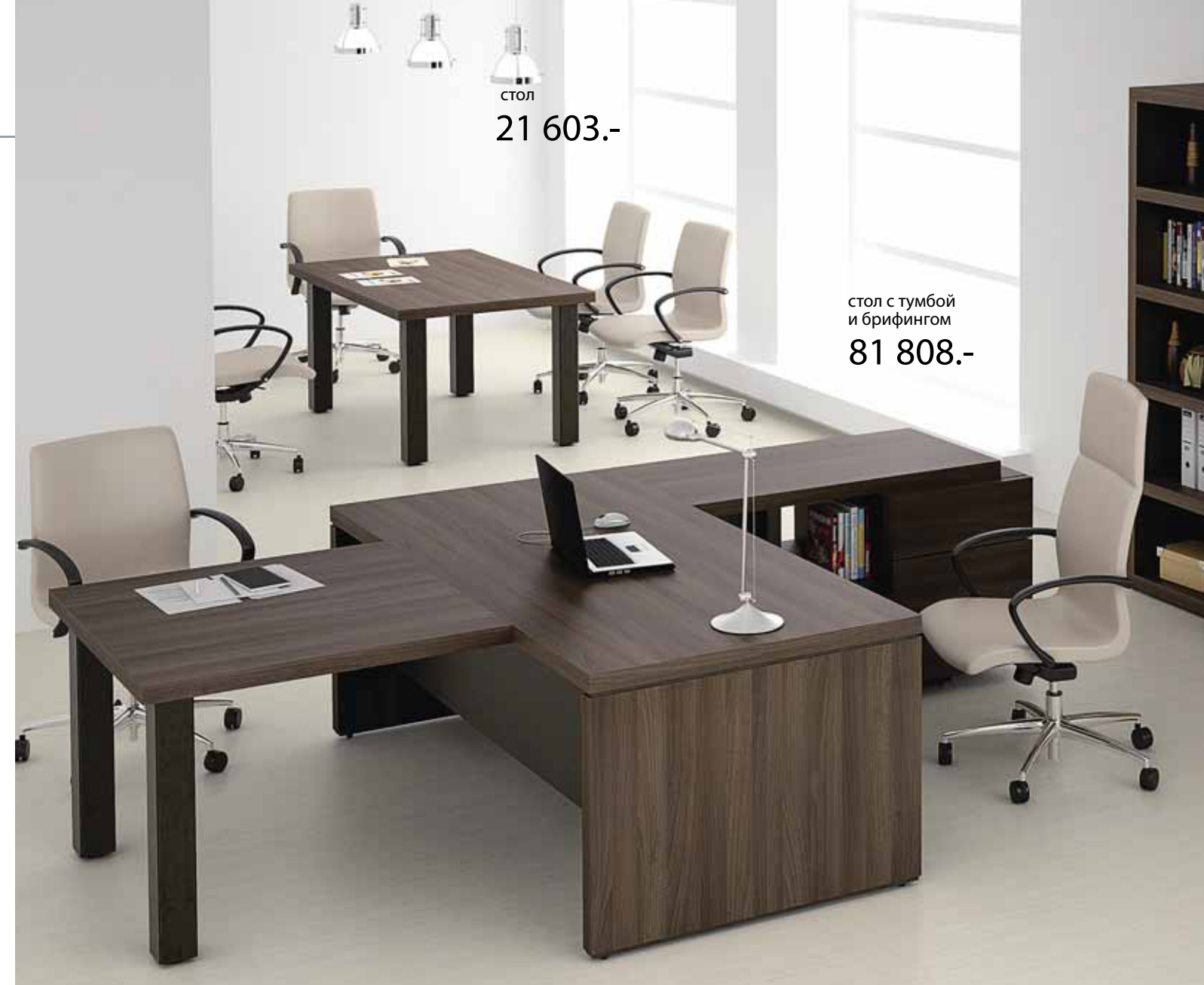
стол 21 603.-

Кабинет BONN произведен по последнему слову мебельной моды: применение облегченной плиты «Евролайт» и акриловой кромки с трехмерным эффектом - создают визуальный эффект кабинета из массива натурального дерева.