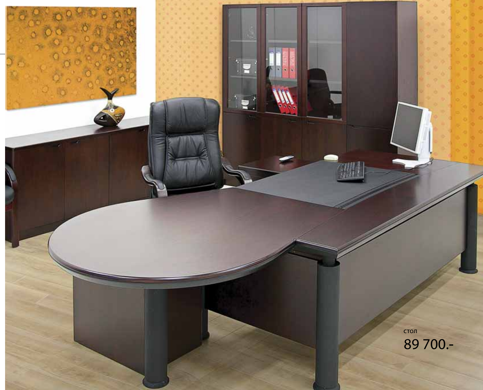
стол 89 700.-