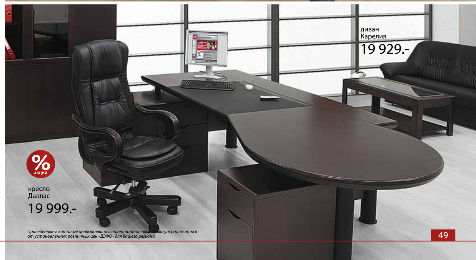
диван Карелия 19 929.-