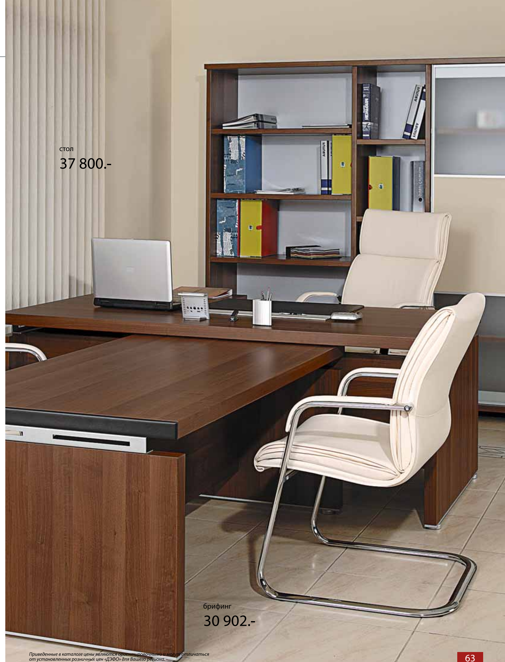
стол 37 800.-