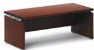
37 768.- MAN 195 конференц-стол 200x90 h70