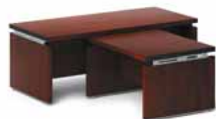
37 800.- MAN 195 стол руководителя 200x90 h75 30 902.- MAN 195/2 стол-брифинг 120x90 h70