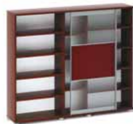
103 660.- MAN 280/1 шкаф для документов 238x45 h190