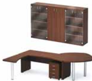
53 410.- Tango 20 СТ9-18Р стол 10 618.- СП9-1н1 стол приставной 6 483.- ТВ9-04з тумба 4 870.- СО9-7н3 брифинг угловой 9 860.- Ш-34 витрина (2 шт.) 14 726.- Ш-32з шкаф 6 853.-