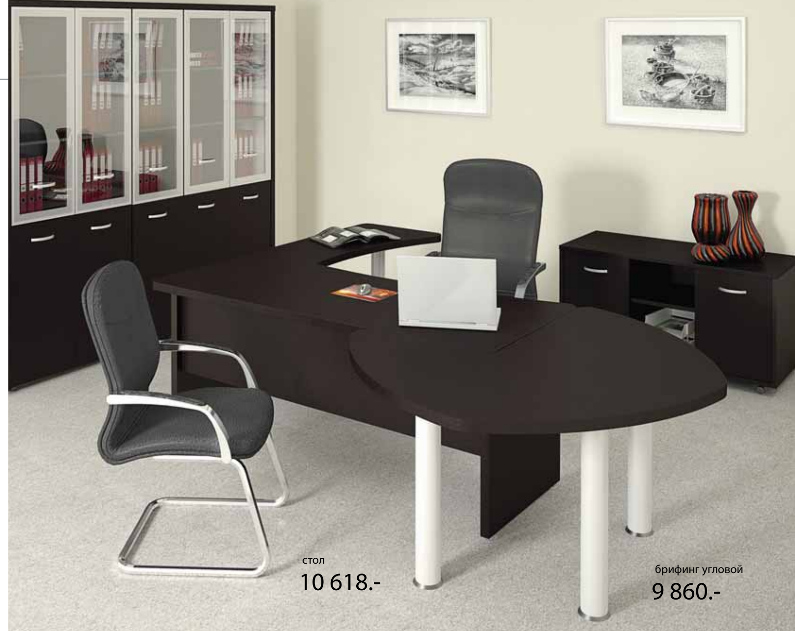
стол 10 618.-