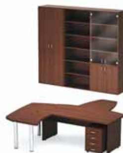
62 278.- Tango 25 СТ9-Р18 стол 11 109.- СП9-1н1 стол приставной 6 483.- ТВ9-04з тумба 4 870.- СП9-4н1 брифинг 6 764.- СП9-2н2 стол приставной 8 056.- Ш-14з шкаф-витрина 10 705.- Ш-11з гардероб 7 960.- Ш-13 стеллаж 6 331.-