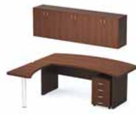
36 695.- Tango 22 СТ9-Р20Р стол 12 205.- СП9-1н1 стол приставной 6 483.- ТВ9-04з тумба 4 870.- Ш-52з шкаф (3 шт.) 13 137.-