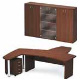
51 868.- Tango 24 СТ9-Р18Р стол 11 109.- СП9-4н1 брифинг 6 764.- ТВ9-04з тумба 4 870.- СП9-2н2 стол приставной 8 056.- Ш-34 витрина 7 363.- Ш-32з шкаф (2 шт.) 6 853.-