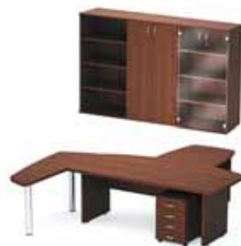
51 314.- Tango 23 СТ9-Р20 стол 12 205.- СП9-7 стол приставной 7 370.- ТВ9-04з тумба 4 870.- СП9-2н2 стол приставной 8 056.- Ш-33 стеллаж 4 597.- Ш-32з шкаф 6 853.- Ш-34 витрина 7 363.-