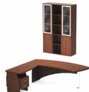
65 375.- Tango-Lux 07 СТ91-02L стол 32 994.- Tango-Lux3 шкаф 32 381.-