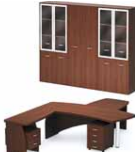
92 865.- Tango-Lux 08 СТ91-02L стол 32 944.- СП9-7 стол приставной 7 370.- ТВ9-04з тумба 4 870.- Tango-Lux4 шкаф 47 631.-