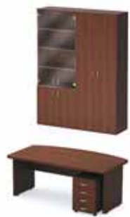
34 644.- Tango 19 СТ9-Р18 стол 11 109.- ТВ9-04з тумба 4 870.- Ш-14з шкаф-витрина 10 705.- Ш-11з гардероб 7 960.-