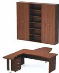
52 429.- Tango 21 СТ9-18Р стол 10 618.- СП9-1н1 стол приставной 6 483.- ТВ9-04з тумба 4 870.- СП9-3н1 стол приставной 6 764.- Ш-13 стеллаж 6 331.- Ш-11з гардероб 7 960.- Ш-12з шкаф 9 403.-