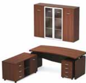
57 217.- Tango-Lux 06 СТ9-Р18RS стол 14 633.- М9-04R тумба 8 809.- ТВ9-04з тумба 4 870.- Tango-Lux2 шкаф 28 905.-