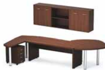
51 382.- Tango 26 СТ9-18 стол 10 618.- СП9-7н3 брифинг угловой 9 860.- ТВ9-04з тумба 4 870.- СП9-2н2 стол приставной 8 056.- Tango-Lux1 шкаф 17 978.-