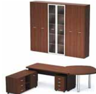
76 334.- Tango 27 СТ9-18 стол 10 618.- СП9-7н3 брифинг угловой 9 860.- ТВ9-04з тумба 4 870.- ТМ9-04R тумба 8 809.- Tango-Lux5 шкаф 42 177.-